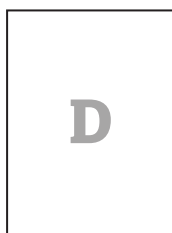
Bodem 1 stuk 120 x 150 mm